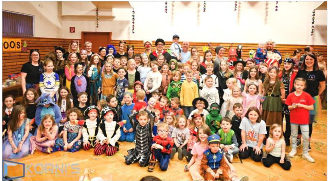
Mehr als 100 Kinder freuten sich über den Besuch des Bürgermeisters als Harry Potter

Der Elternverein hat auch heuer wieder die Organisation des Kindermaskenballs übernommen, welcher zum dritten Mal mit Unterstützung der Marktgemeinde Wiesmath veranstaltet werden konnte. Das Vereinshaus war auch dieses Mal wieder gut gefüllt mit vielen maskierten Kindern und Eltern. Gemeinsame Tänze, Spiele, Krapfen sowie der Besuch des Luftballonbinders machten diesen Nachmittag wieder zu einem schönen Erlebnis.