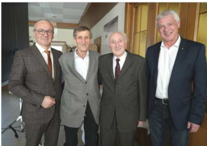
Am Foto sind die Bürgermeister der letzten 51 Jahre vereint:

Seitens der Marktgemeinde Wiesmath gratulieren wir nochmals recht herzlich und wünschen weiterhin viel Gesundheit und alles Gute!