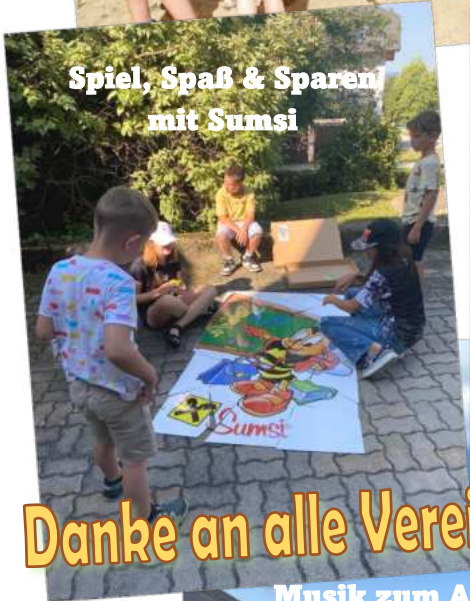
Spiel, Spaß & Sparen mit Sumst