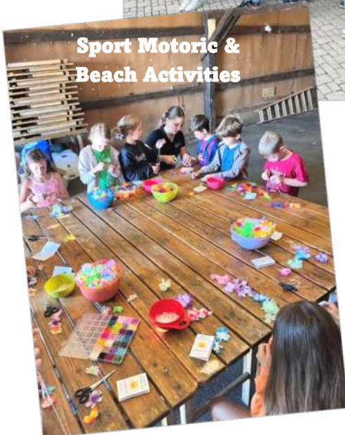
Sport Motoric & Beach Activities