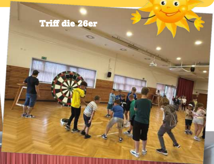
Triff die 26er