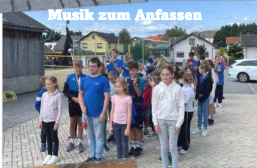
Musik zum Anfassen

Danke an alle Vereine und Mitwirkenden für die Organisation!