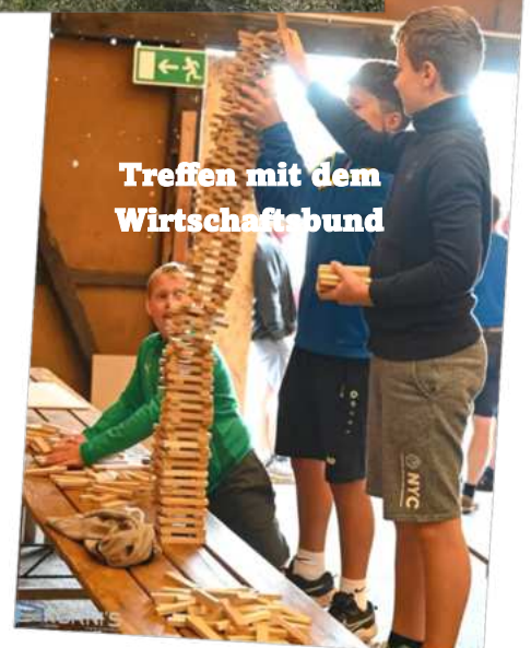
Treffen mit dem Wirtschaftsbund