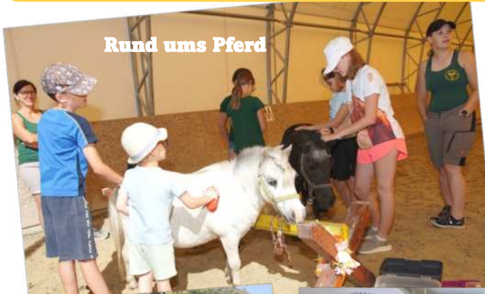
Rund ums Pferd