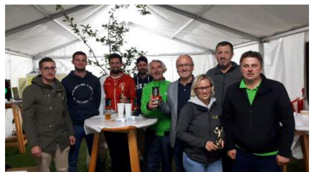
Sieger des Jux-Doppeltturniers (FF Wiesmath)