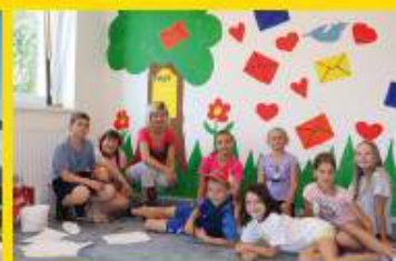
Gestaltung durch die VS-Kinder