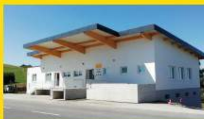
Nach dem Umbau