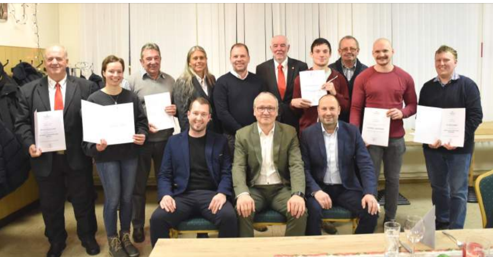
Überreichung von Ehrungen und Beförderungen an Rotkreuz-Mitarbeiter im Rahmen der Jahresfeier am 02.12.2022 im Kisterl