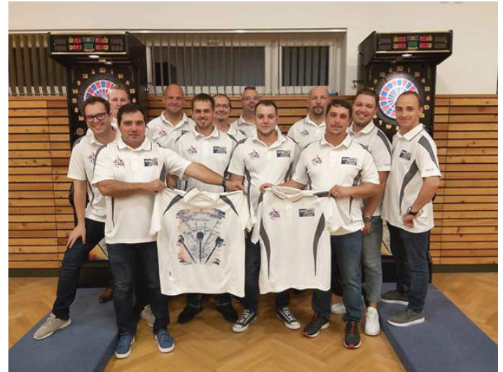
Vorstand und Spieler des DVW-26er

Im Rahmen des diesjährigen Ferienspiels durften wir auch den Kindern diesen Sport spielerisch näherbringen. Es war uns eine Freude, dass uns mehr als 50 Kinder an diesem Vormittag besucht haben und Spaß an dieser Veranstaltung hatten.